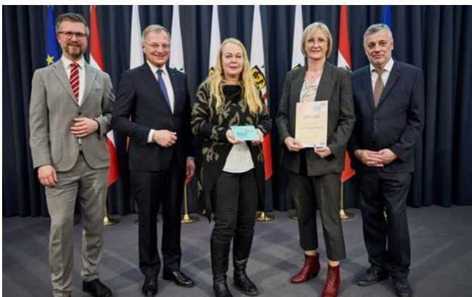
Gütesiegel-Verleihung an die MS Oberneukirchen

Das Gütesiegel OÖ Meistersingerschule wird an eine Schule für vorbildliche qualitätsvolle Zusammenarbeit im Bereich chorischer Jugendarbeit vergeben. Es ist ein sichtbares Zeichen für gelebte Chorpraxis und eine funktionierende Zusammenarbeit im schulischen Umfeld.